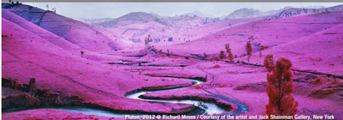
Platon, 2012